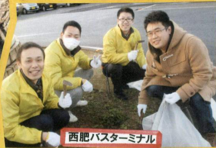
西肥バスターミナル