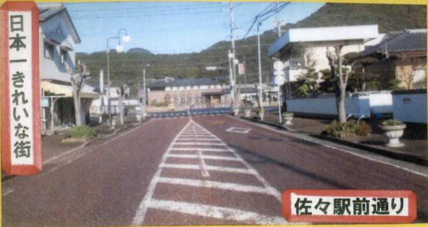
日本一きれいな街