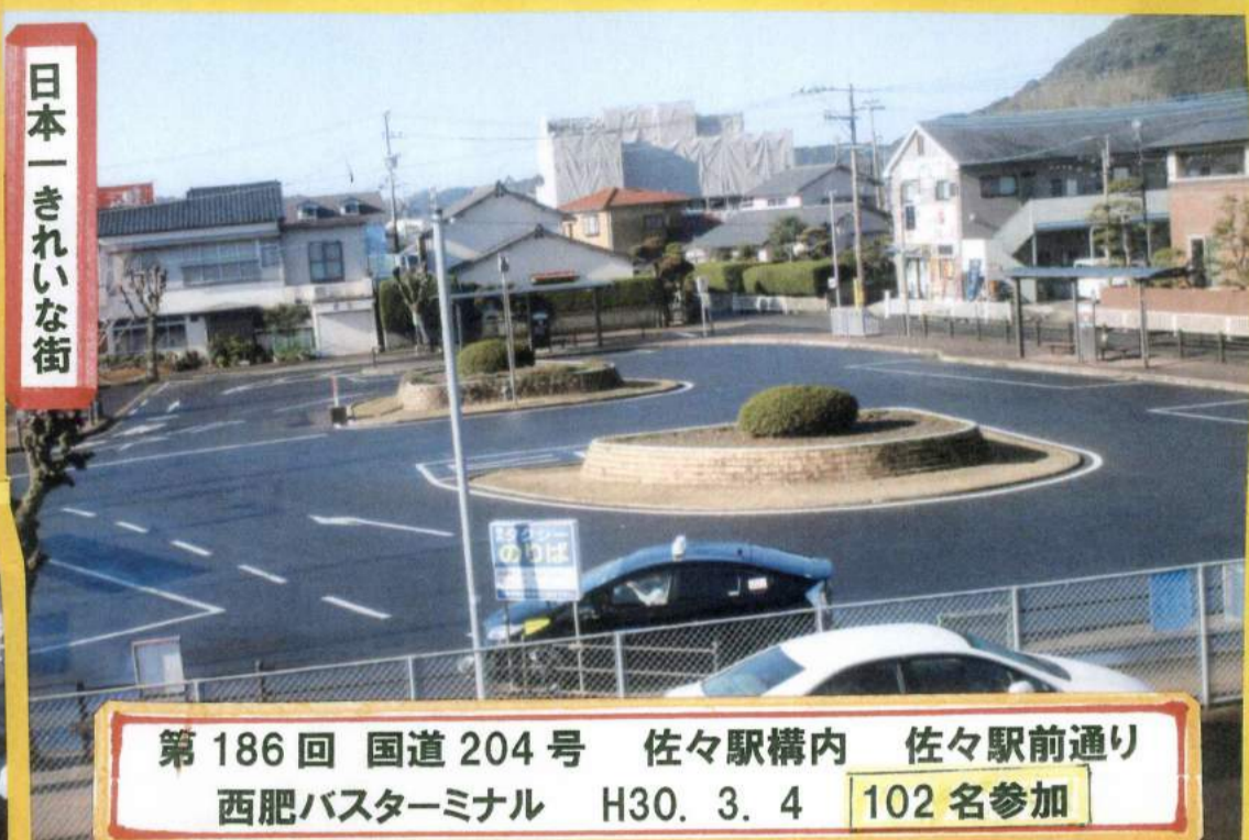
日本一きれいな街

第186回 国道204号 佐々駅構内 佐々駅前通り 西肥バスターミナル H30. 3. 4 102名参加